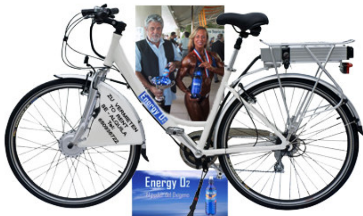
Modell: "NATI - Wellness" Made en Spain

Mit der Übernahme des Stammkapital der, S.L. e.c. NEUERÖFFNUNG, BETRIEBSFERTIGES ELEKTRO BIKE –Verleih & Auflade & Cafe Shop-Station, S.L. ec ORIGINAL „ ENERGY-02 –Elektro-BIKE's,,