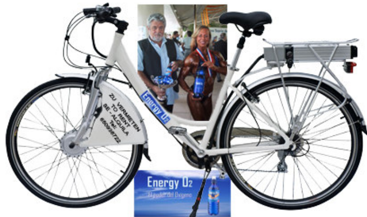
Modell: "NATI - Wellness" Made en Spain

mit der Übernahme des Stammkapital der, S.L. ec.